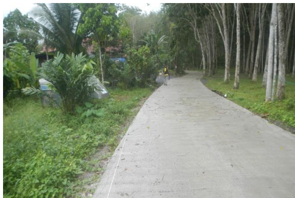
โครงการก่อสร้างถนนคอนกรีตเสริมเหล็กถนนสายบ้านนายฉาย – สวนยางนายบุญธรรม หมู่ที่ 2 ตำบลบ้านชะอวด