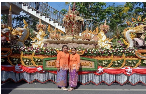
โครงการจัดงานประเพณีเดือนสิบ ประจำปีงบประมาณ พ.ศ.2565