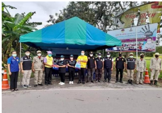
โครงการจัดงานวันกตัญญู ประจำปีงบประมาณ พ.ศ.2565