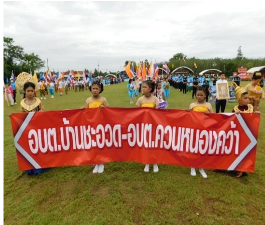
โครงการจัดงานประเพณีเทศกาลเดือนสิบ/จังหวัดนครศรีธรรมราช ประจำปีงบประมาณ พ.ศ.2565