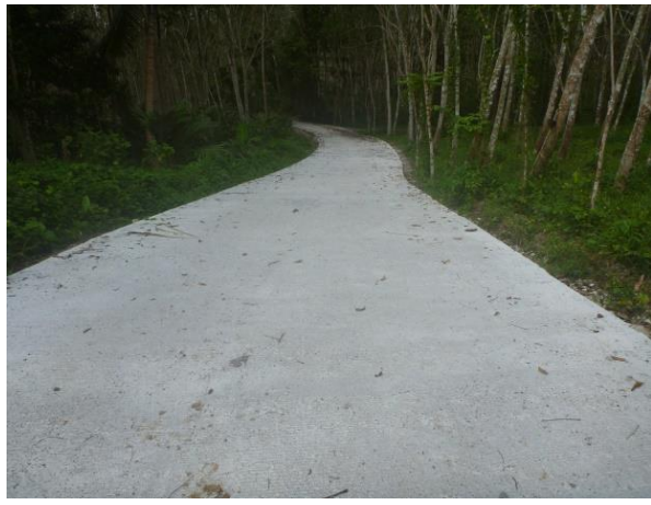
โครงการปรับปรุงผิวจราจรถนนสายบ้านนายอนงค์-สามแยกถนนสายบ้านนายอนันต์-ตรอกจิก หมู่ที่ 4 ตำบลบ้านชะอวด