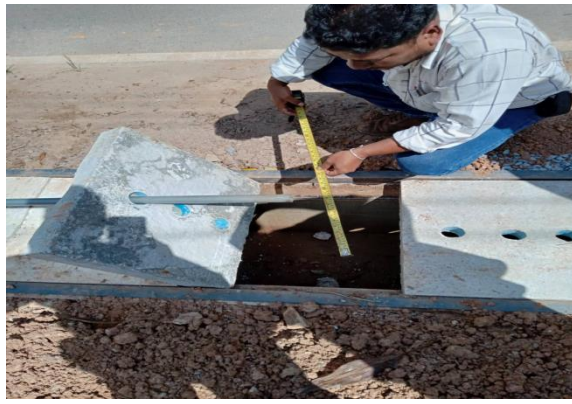
โครงการขุดลอกคูระบายน้ำในเขตองค์การบริหารส่วนตำบลบ้านชะอวด ประจำปีงบประมาณ พ.ศ.2565