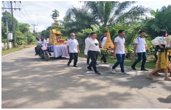
โครงการสนับสนุนประเพณีชักพระ ประจำปีงบประมาณ พ.ศ.2565